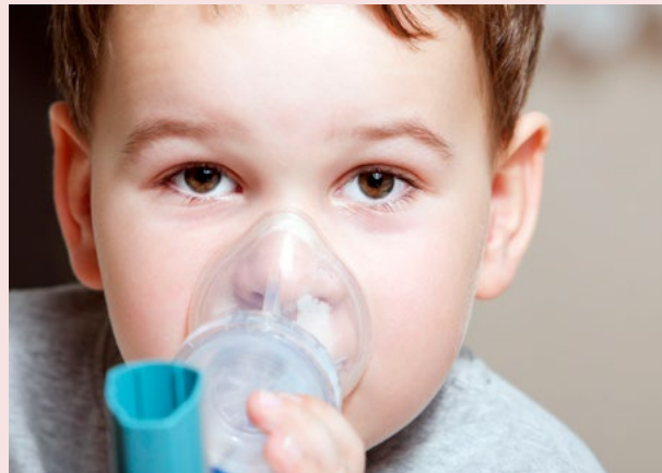
Abbildung 2. Inhalation mit Spray und Inhalierhilfe

Zur Erweiterung der Bronchien und Unterstützung des Schleimtransports werden sogenannte Beta-Mimetika (z. B. Salbutamol) entweder zur Inhalation oder zum Einnehmen (z. B. SalbuBronch® Elixier) verabreicht. Zusätzlich kann auch mit Atrovent®, einem Bronchialerweiterer mit anderem Wirkungsansatz, inhaliert werden. Die Inhalation wird bevorzugt mit einem Spray (Dosieraerosol) mit Inhalierhilfe oder mit einem elektrischen Inhaliergerät durchgeführt (Abb. 2). Bei